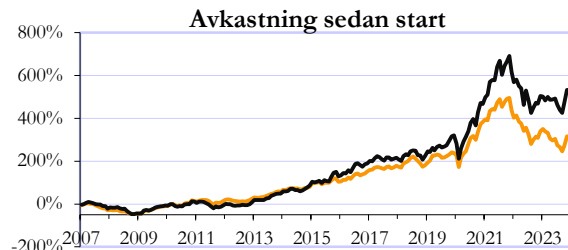
Småbolagsfonden Mid Cap Index

Förvaltningens mål är att långsiktigt uppnå en god värdetillväxt till en lägre risk än aktiemarknaden som helhet. Den lägre risken uppnås genom fokusering på stabila företag och genom att vara restriktiv när det gäller så kallade förväntningsbolag. Fonden riktar sig till kunder som vill investera i småbolag men som samtidigt vill ha en relativt försiktig förvaltning.